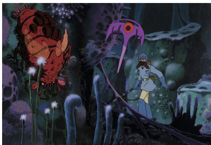
"Nausicaä z Doliny Wiatru", 1984

Zapraszamy wszystkich, bo opowieści z krainy Ghibli to z pewnością rozrywka zarówno dla tych małych, jak i dużych.